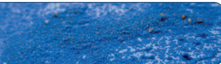
AQUA-Collage (50 715)

AQUA-Collage bleibt wasserlöslich; es kann mit AQUA-Fix kombiniert werden für Wasserfestigkeit und Übermalbarkeit. Nicht in Näpfchen einbringen!