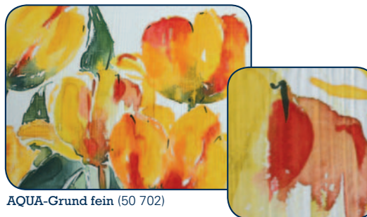
AQUA-Grund fein (50 702)

Mit AQUA-Grund fein (50 702) oder grob (50 703) können Untergründe wie Leinwand, Malpappe etc. aquarellfähig gemacht werden. Die Grundierungen können mit HORADAM® AQUARELL-Tubenfarbe eingefärbt werden. AQUA-Grund fein für glatte Oberflächen wird mit dem Pinsel in drei Schichten dünn aufgetragen oder dünn-schichtig mit einem Spachtel aufgezogen. AQUA-Grund grob für aquarellpapierartige Oberflächen wird aufgespachtelt. Nach dem Trocknen können die Untergründe bemalt werden.