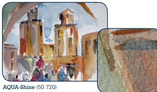
AQUA-Shine (50 720)

AQUA-Shine (50 720) ist ein irisierendes Malmittel für schillernde Effekte und Perlmuttglanz. Kann pur oder gemischt mit (transparenten) Aquarellfarben aufgetragen werden. Effektabschwächung durch Wasserverdünnung möglich. Wirkt zudem leicht trocknungsverzögernd, bleibt wasserlöslich. AQUA-Shine nicht in Näpfchen einbringen! Vor Gebrauch schütteln.