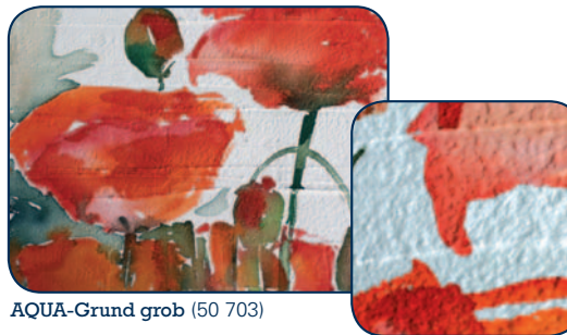
AQUA-Grund grob (50 703)