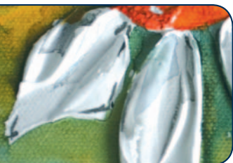
AQUA-Spachtelmasse fein (50 706)

AQUA-Spachtelmasse grob ergibt körnige, die feine Variante hingegen glatte Oberflächen.