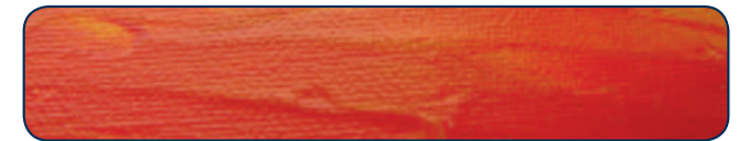
AQUA-Pasto (50 725)

AQUA-Pasto (50 725) ist ein transparentes Verdickungsmittel für Tubenaquarellfarbe. Es ermöglicht das (dünn-schichtige) Aufspachteln von Aquarellfarben und reduziert zudem Farbfluss und Verlauf. AQUA-Pasto wirkt glanzsteigernd und bleibt wasserlöslich.