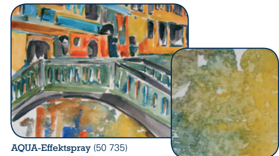
AQUA-Effektspray (50 735)

AQUA-Effektspray (50 735) wirkt farbvertreibend und sorgt so für bizarre Spritz- und Sprenekeffekte. Das Effektspray wird in die nasse bzw. feuchte Aquarellfarbe mit einem Abstand von 20 – 30 cm eingesprüht. Auszusparende Bereiche müssen abgedeckt werden. Wirkt nicht auf 100% Hadern-/Baumwollpapieren.